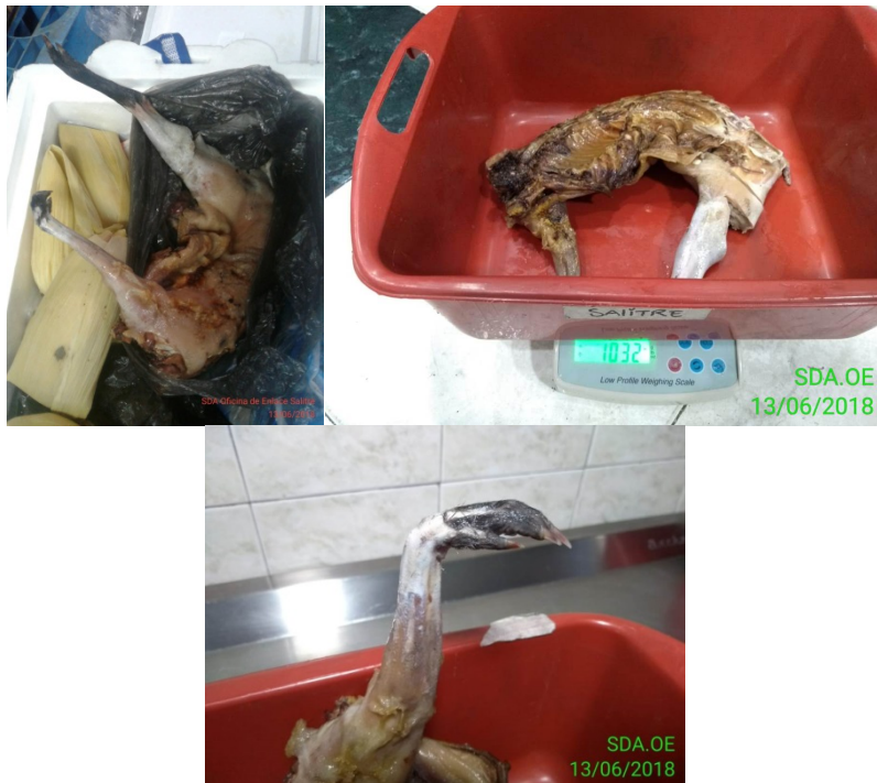
Figura 2, 3, 4 . Verificación de 1032 g de Dasyprocta sp Acta Única de Incautación No. 103128

El guatín o ñeque ( Dasyprocta sp.) es un roedor perteneciente a la familia DASYPROCTIDAE , en el que se encuentran roedores diurnos de mediano tamaño, alargados y delgados, habitantes de tierras bajas a medianas elevaciones en bosques tropicales, bosques secos, sabanas y zonas modificadas por el hombre como lo son cultivos. Se caracterizan por poseer extremidades anteriores y posteriores delgadas y alargadas en especial el fémur, lo que indica una especialización para la realización de desplazamientos veloces (Patton et. Al. 2015).