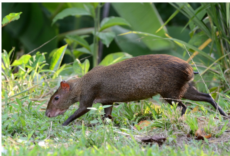
Figura 5. Ejemplar de Ñeque ( Dasyprocta sp.). La fotografía se presenta con el fin de ilustrar las características fenotípicas de la especie; el ejemplar presentado no fue registrado durante este procedimiento.

Es entonces importante detener todas estas actuaciones individuales de captura ilegal de fauna silvestre, así como su comercialización y tenencia; ya que cada una representa un porcentaje del daño general que esta actividad le genera a los recursos naturales. Para lograrlo, además de la educación y la vigilancia, es entonces necesario sancionar ejemplarmente a todos y cada uno de los que hacen parte de este flagelo, con lo que también se disuadirá a los futuros infractores de realizar estas actividades y así lograr disminuir significativamente o eliminar el daño a los recursos naturales.