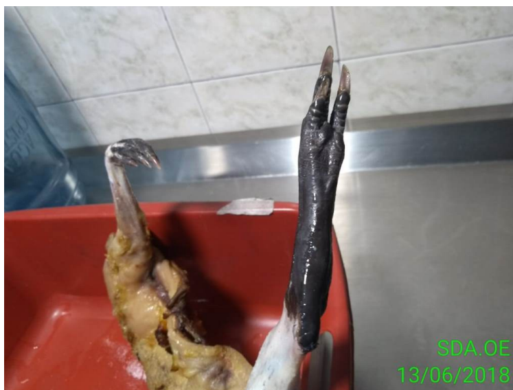
Figura 6, Carne incautada de Ñeque ( Dasyprocta sp), nótese tres dedos con garras en su apéndice trasero.

Como se observa en la tabla anterior, ninguna de las dos especies se encuentra en categoría de amenaza VU, EN o CR; sin embargo, las poblaciones de estas especies, enfrentan presiones como la extracción del medio natural para ser tenidas como mascotas o para consumo humano, que, de no regularse, puede generar un decrecimiento importante en sus poblaciones naturales. Dasyprocta sp., tampoco se encuentra listada en los Apéndices de la Convención sobre el Comercio Internacional de Especies Amenazadas de Fauna y Flora Silvestre – CITES.