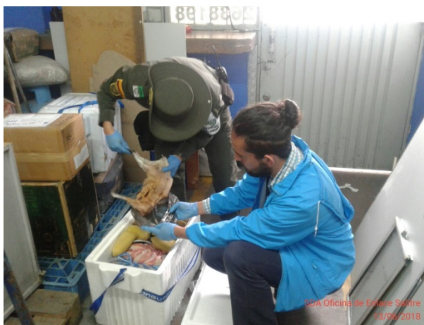
Figura 1. Procedimiento de incautación de 1032 g de Dasyprocta sp. , Acta Única de Incautación No. 160382

Se procedió a llevar la cava de refrigeración a las oficinas de la Secretaría Distrital de Ambiente donde se realizó la verificación por parte del profesional a cargo, y se corroboró que se trataba de 1032 g de carne, cuyas características morfológicas y caracteres diagnósticos descritos en el numeral 4. (CONCEPTO Y ANÁLISIS TÉCNICO), permitieron determinar que pertenecen a la especie Dasyprocta sp. perteneciente a la fauna silvestre colombiana (Figura 1).